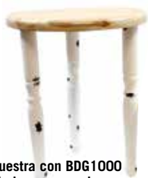
Se muestra con BDG1000 (la base se vende por separado)