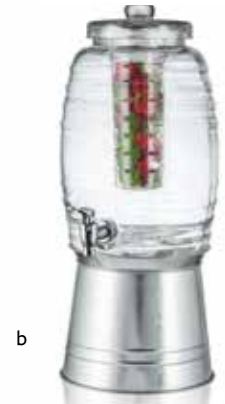
Shown with BDG1000 (base sold separately)